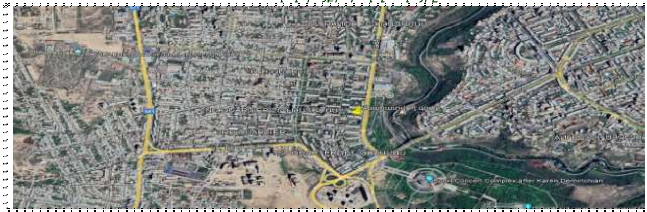
Գնահատվող գույքի գտնվելու վայրը

https://www.google.ru/maps/place/17+Halabyan+St,+Yerevan+0038/@40.1938427,44.4779389,300m/data=!3m1!1e3!4m6!3m5!1s0x406abd740534c977:0xace89a2d1ff5705!8m2!3d40.1938919!4d44.4778947!16s%2Fg%2F11c0y_nj_x?entry=ttu