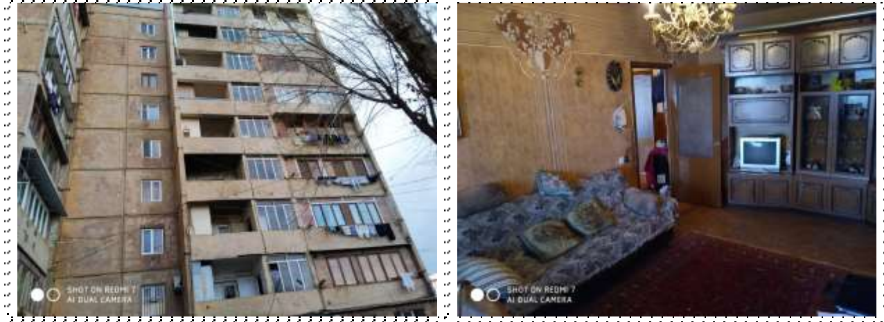
Անշարժ գույքի լուսանկարները