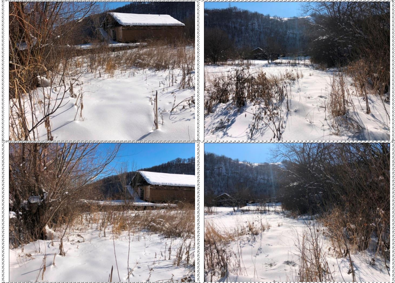
Անշարժ գույքի լուսանկարները