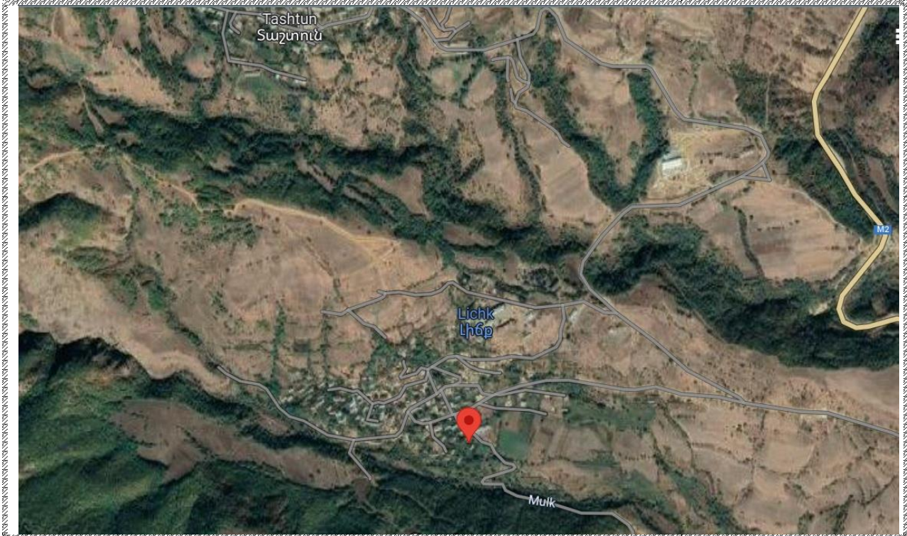
Գնահատվող գույքի գտնվելու վայրը

https://www.google.com/maps/place/39%C2%B003'17.6%22N+46%C2%B010'28.8%22E/@39.0548411,46.1745321,129m/data=!3m1!1e3!4m4!3m3!8m2!3d39.054898!4d46.17467