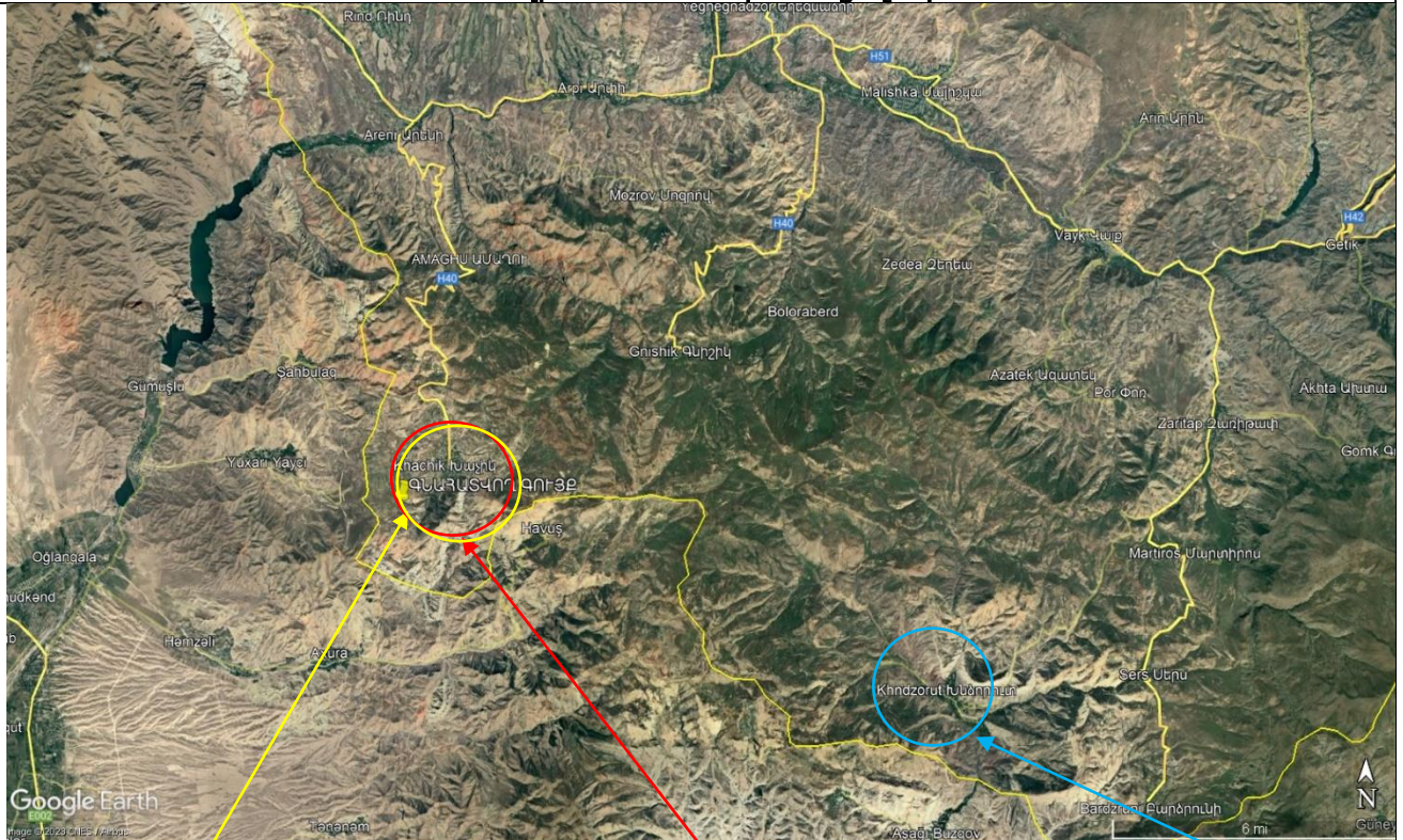
Թիվ 1 համեմատական տվյալ