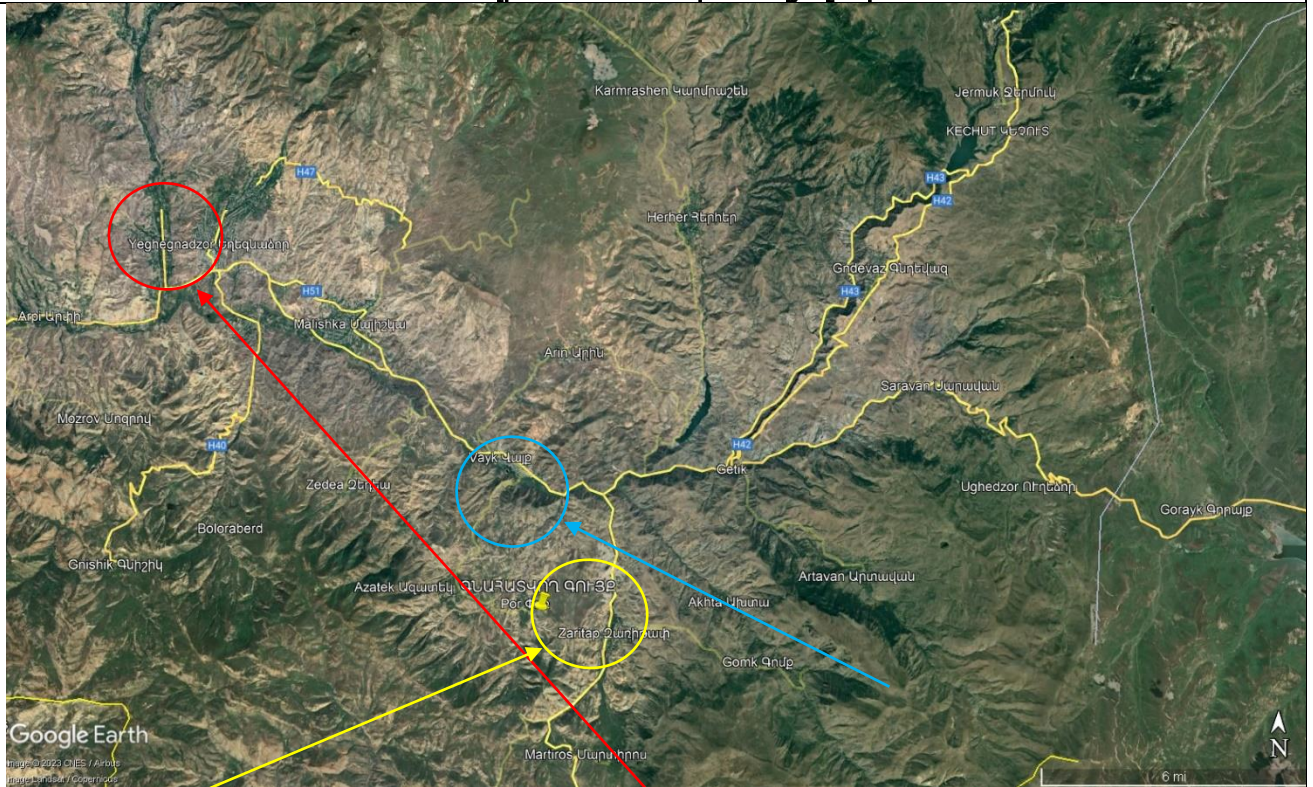
Թիվ 1 համեմատական տվյալ