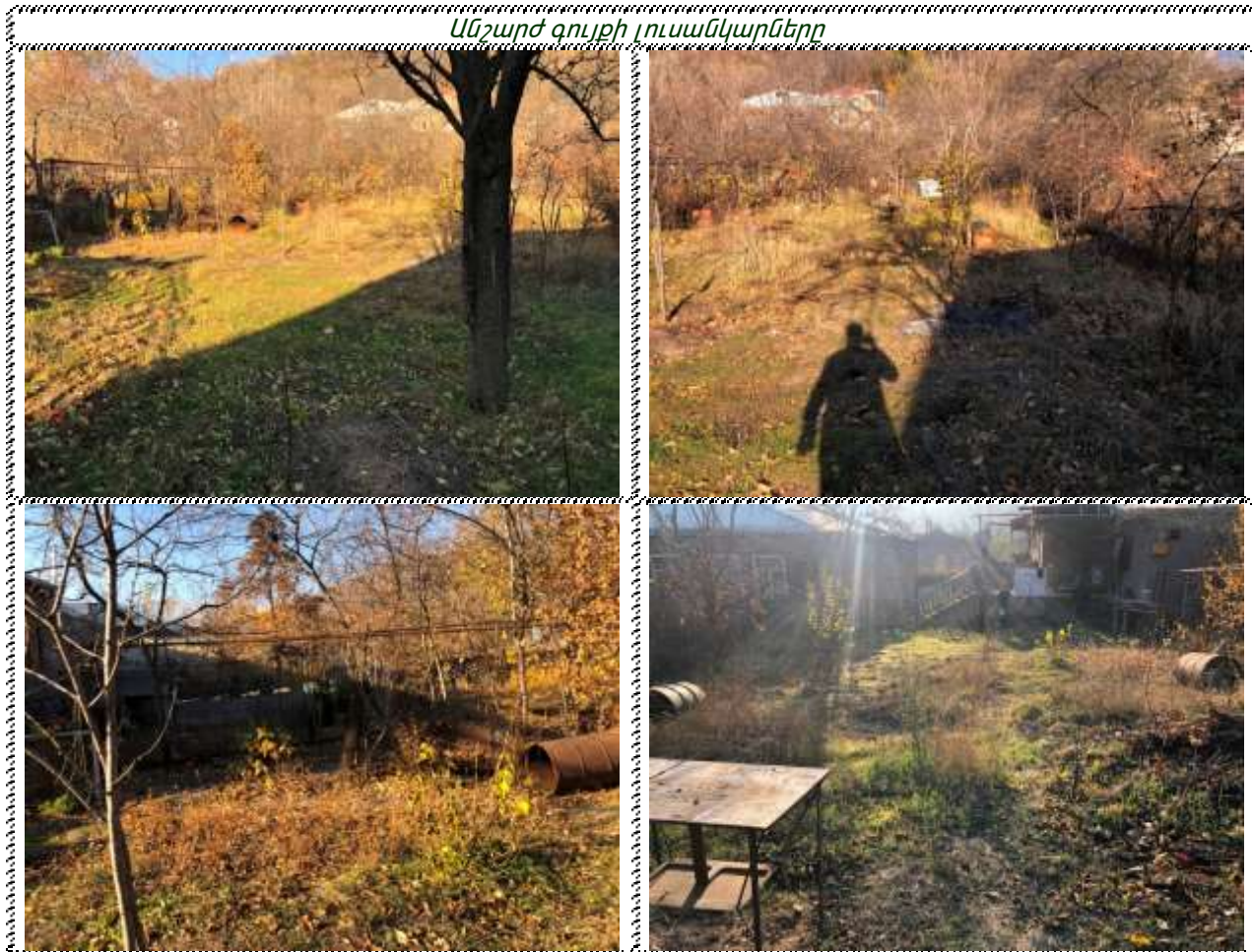
Անշարժ գույքի լուսանկարները