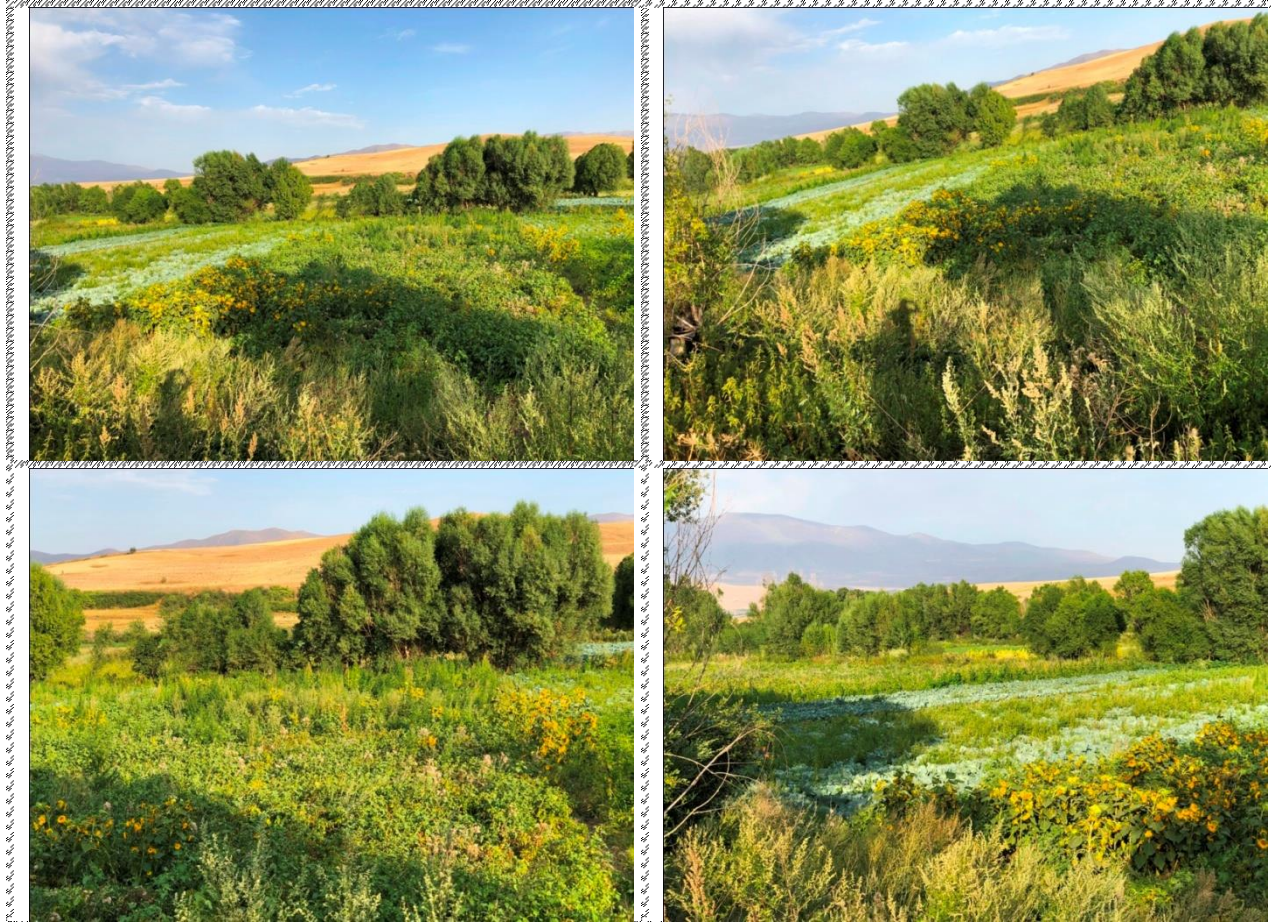
Անշարժ գույքի լուսանկարները