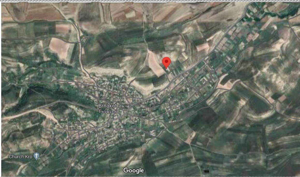
Գնահատվող գույքի գտնվելու վայրը

https://www.google.com/maps/place/39%C2%B030'09.6%22N+45%C2%B058'50.5%22E/@39.5037756,45.980859,8.694m/data=!3m1!1e3!4m5!3m4!1s0x0:0xb34be95795a4cea1:18m2!3d39.502679!4d45.980699