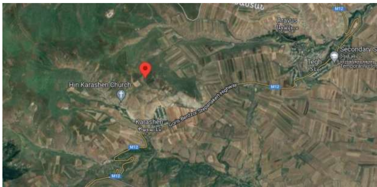
Գնահատվող ուլթի տվելու վայրը

https://www.google.com/maps/place/39%C2%B033'26.1%22N+46%C2%B022'51.1%22E/@39.5573363,46.380861,103m/data=!3m1!1e3!4m5!3m4!1s0x0:0xa9a73cc2fedce49b18m2!3d39.557242!4d46.380867