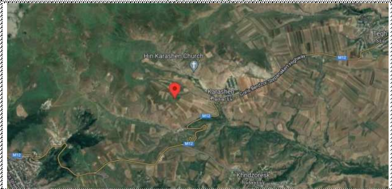
Գնահատվող գույքի գտնվելու վայրը

https://www.google.com/maps/place/39%C2%B032'17.5%22N+46%C2%B023'57.3%22E/@39.5385343,46.3989052,392m/data=!3m1!1e3!4m5!3m4!1s0x0:0xefc2f9a5619f2bc1!8m2!3d39.53820214d46.399248