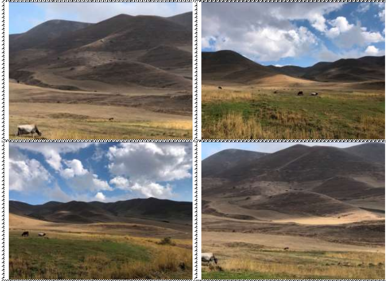
Անշարժ գույքի լուսանկարները