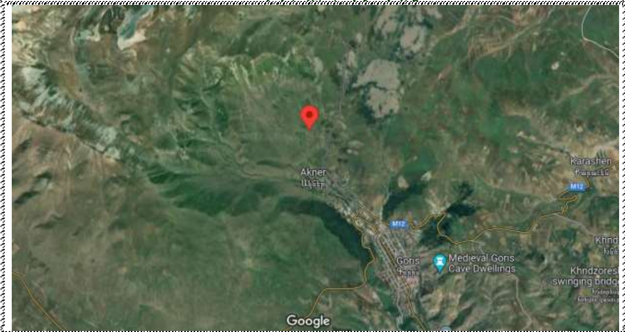
Գնահատվող գույքի գտնվելու վայրը

https://www.google.com/maps/place/39%C2%B033'01.5%22N+46%C2%B018'16.5%22E/@39.5515361,46.3060053,1117m/data=!3m1!1e3!4m5!3m4!1s0x0:0x486621c38b1f90ba!8m2!3d39.550408!4d46.304591