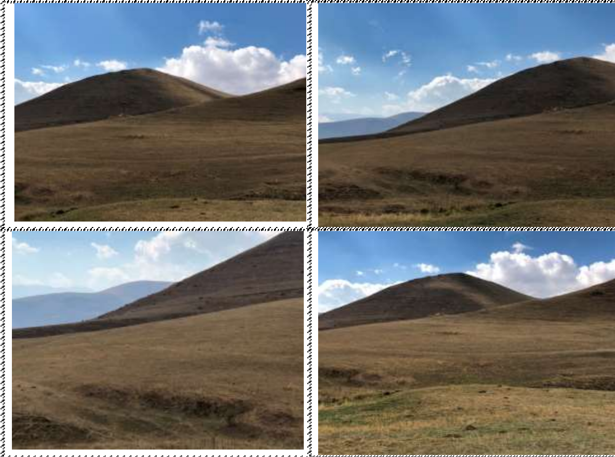
Անշարժ գույքի լուսանկարները