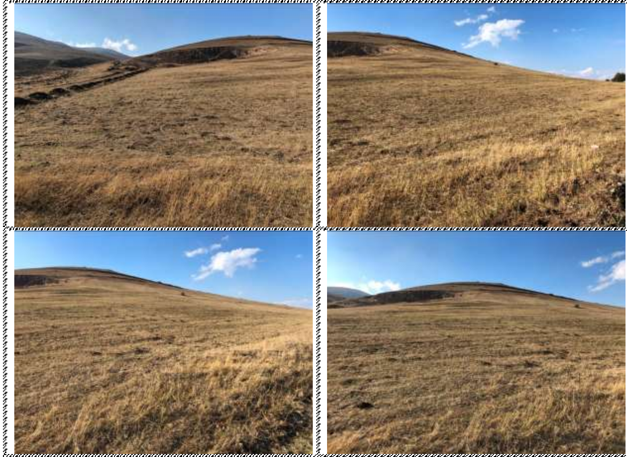
Անշարժ գույքի լուսանկարները