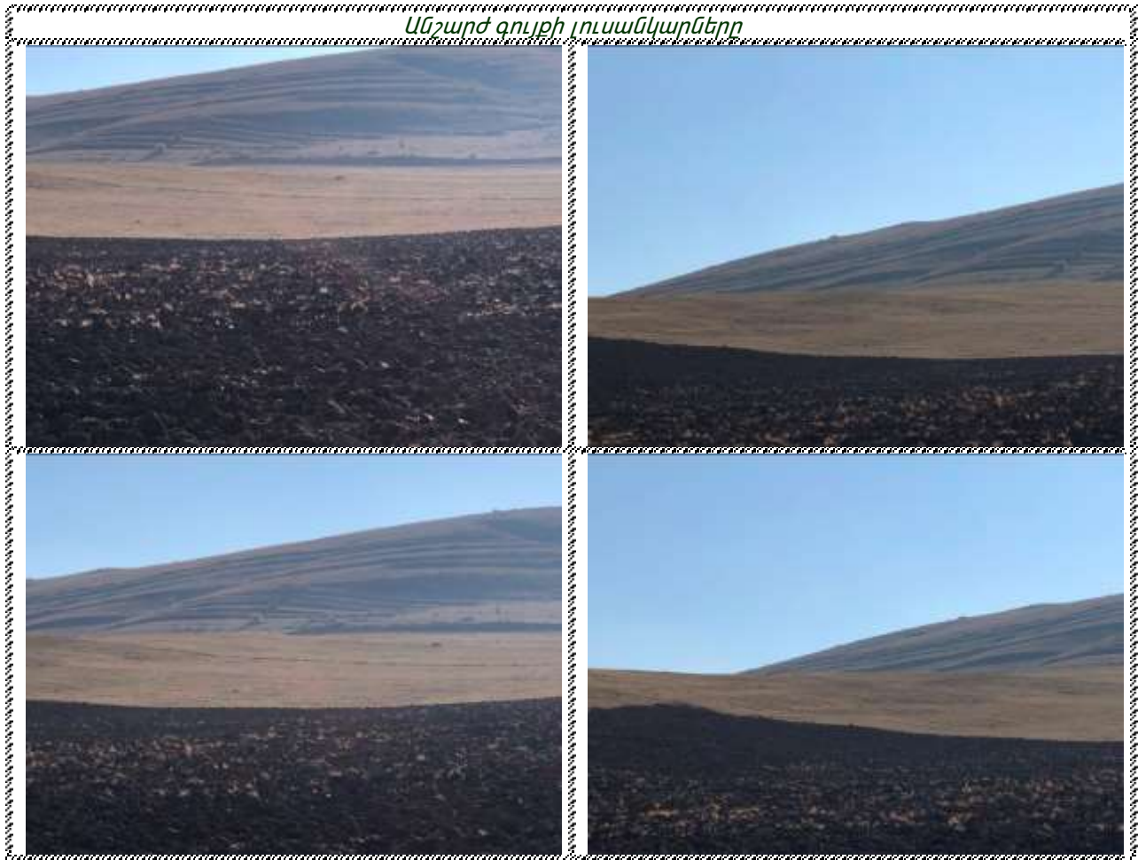
Անշարժ գույքի լուսանկարները