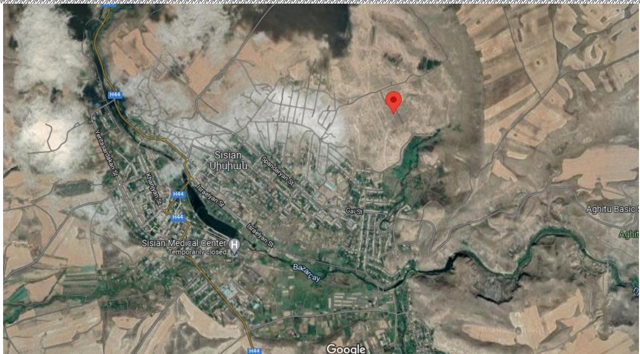
Գնահատվող գույքի գտնվելու վայրը

https://www.google.com/maps/place/39%C2%B031'42.1%22N+46%C2%B002'48.2%22E/@39.5295755,46.0465331,584m/data=!3m1!1e3!4m5!3m4!1s0x0:0xba6f25b9a6497caa!8m2!3d39.528363!4d46.046731